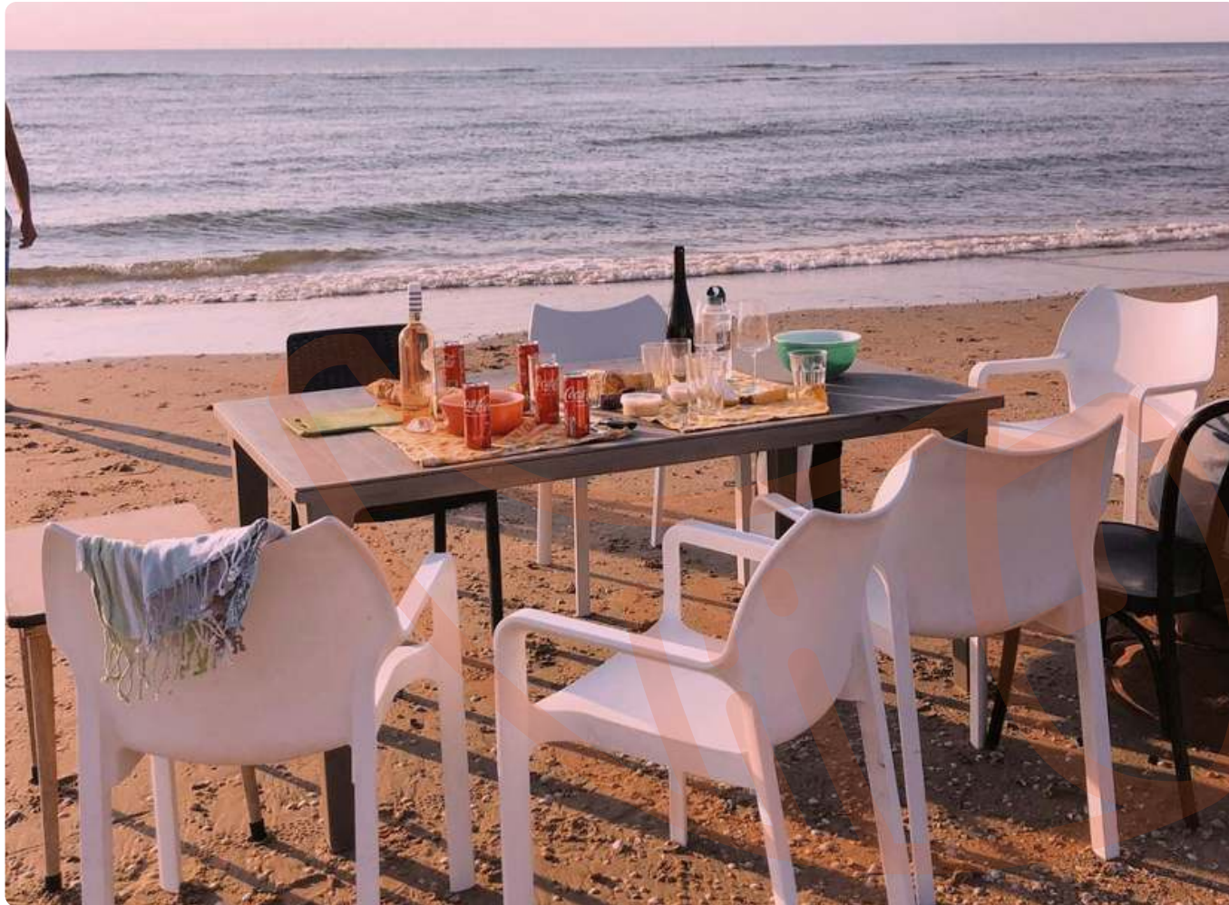
Een diner aan zee is stiller, koeler en veel leuker dan eten bij het huisje.