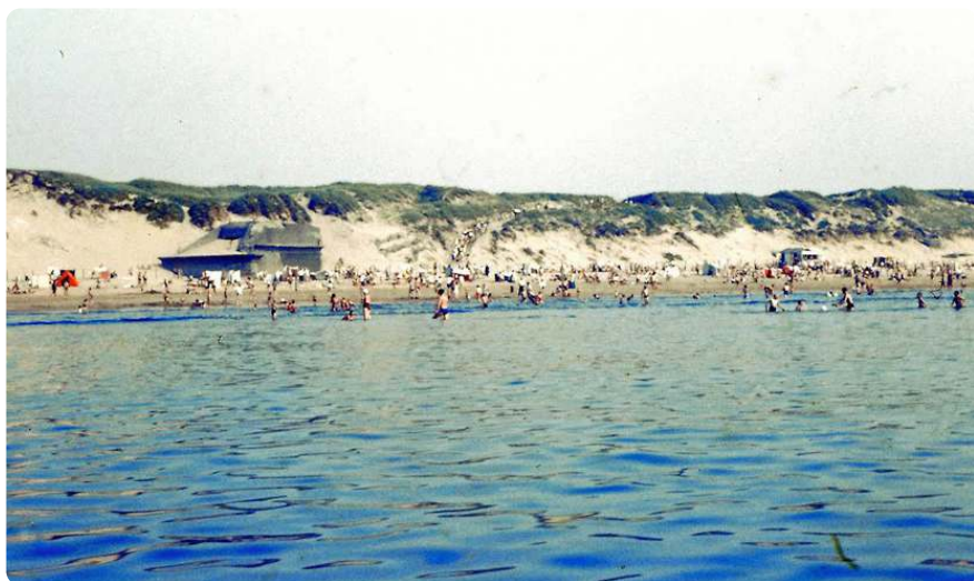
Bunker aan de noordzijde van de strandopgang.

De pret die dat opleverde voor de strandbezoekers was van korte duur, vertelt bunker-specialist Simon de Wit. "Ze leverden gevaar op, omdat er bij vloed spoelgaten ontstonden. Het water en zand kolkten dan langs de bunkers. Voor de duinen was het ook niet goed, er ontstonden trekpaten achter de bunkers." In de winter van 1957-1958 werden de twee bunkers dan ook opgeblazen.