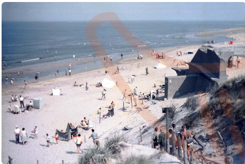
Een bunker op het strand van Heemskerk, ca. 1955.

Wie in de zomer van 1957 strand Heemskerk bezocht, kon in de schaduw van twee enorme bunkers beschutting zoeken. De betonnen geschutsbunkers stonden in de eerste duinenrij totdat een grote storm in 1953 een deel van de duinen wegspoelde. Daardoor kwamen de bunkers half op het strand te staan. In juni 1957 volgde nog een zware zuidwesterstorm. De bunkers kwamen bijna helemaal vrij te liggen. Eén van de bunkers stond ongeveer ter hoogte van waar nu de reddingsbrigade staat, de andere moet ongeveer ter hoogte van de laatste huisjes op zuid hebben gestaan.