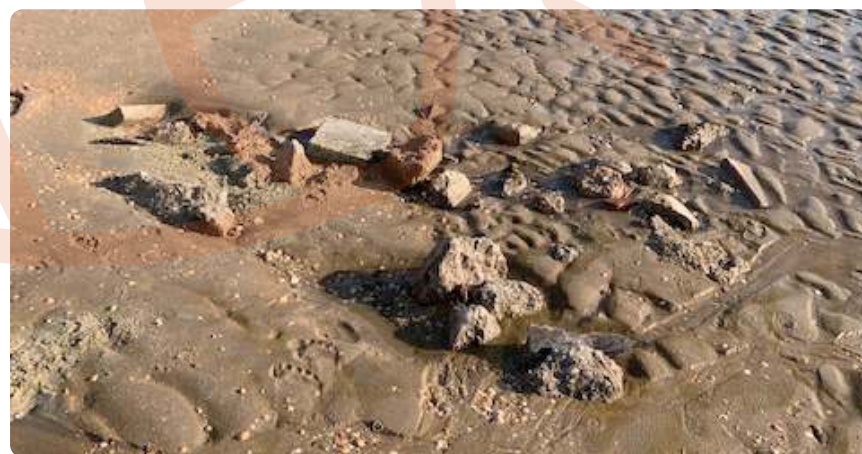
Bunkerresten bij eb, net voorbij 't laatste huisje op Zuid.